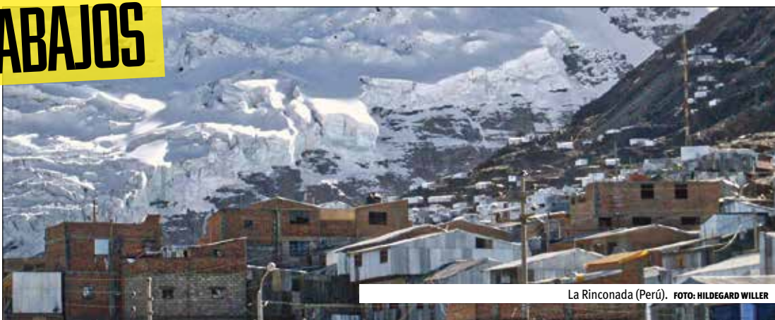
La Rinconada (Perú).

H oy en día, en los tiempos que corren, trabajar siempre es un privilegio que desgraciadamente no todo el mundo puede permitirse. Sin embargo hay trabajos en los que dicho privilegio se convierte en una verdadera tortura: como muestra mencionaré unos cuantos que no debería desempeñar nadie.